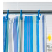
シャワーカーテン