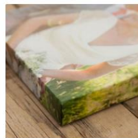
キャンバスプリント