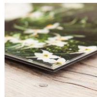
アクリルプリント