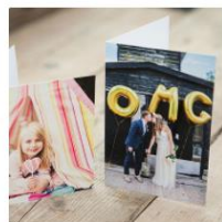
グリーティングカード